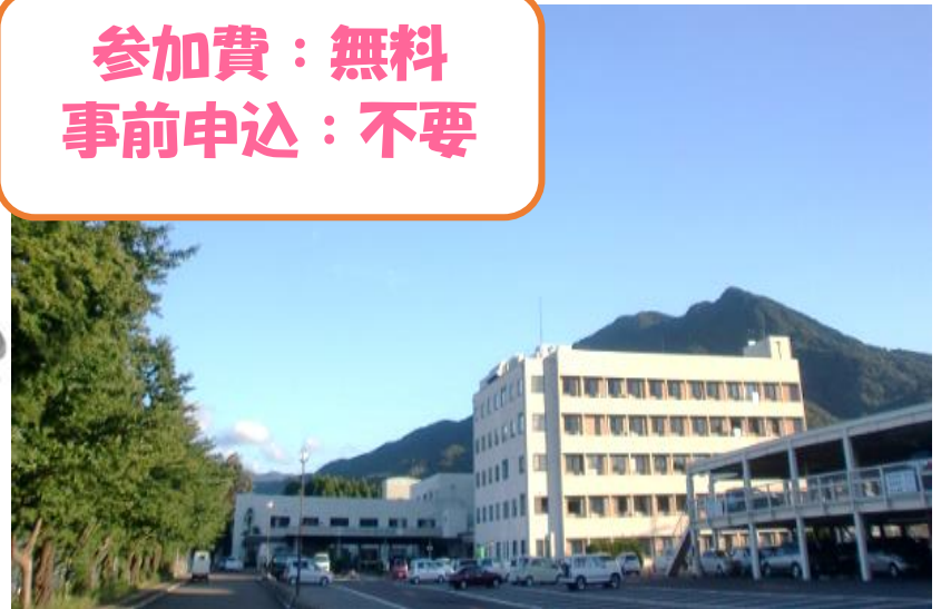
▲国立病院機構 敦賀医療センター