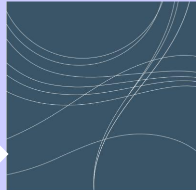
看護職の倫理綱領 監修 日本看護協会

・4月の入職者オリエンテーションで、「看護職と倫理」については日本看護協会の『看護職の倫理綱領』を読解していますが、受け持ち患者の看護展開を始めるこの時期に倫理について学び直しを行いました。看護実践場面では患者さんの「代弁者」としての役割を果たさなければならない責任を研修で伝えています。