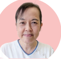
緩和ケア 認定看護師

患者さんや家族が少しでも穏やかに過ごせるよう、症状や気持ちのつらさなどに対応しています。病棟看護師からの緩和ケアについて相談を受けており、患者さんに必要なケアと一緒に考えたり、研修も行っています。