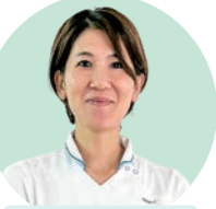
がん性疼痛看護 認定看護師

病棟看護師と共に痛みの評価やアセスメントを行い、早期に痛みが軽減できるように看護実践をしています。がんとともに生きる患者さんが、その人らしい生活を送れるよう痛みの原因を分析し、麻薬などを用いて痛みのコントロールを図っています。