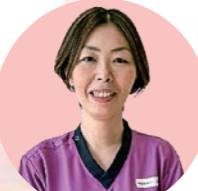
特定看護師 呼吸器関連

手順書に基づき、重病棟に入院中の患者さんの、呼吸管理を実施しています。また、呼吸ケアについて、看護全体の、対応力の向上のために、研修や実践指導を行っています。