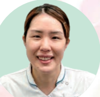
皮膚・排泄ケア 認定看護師

認知症の方は、入院して環境が変わると混乱し、不安になります。病棟看護師と一緒に患者さんのニーズは何かを考え、患者さんが安心して治療を受けていただけるよう支援しています。