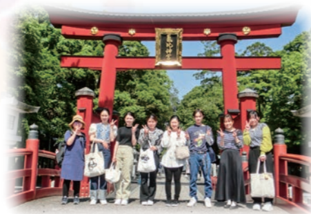
6月 新人看護師 リフレッシュ研修