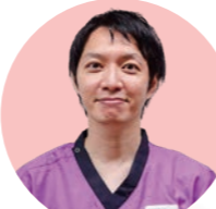
特定看護師 循環器

手順書に基づき、重病棟に入院中の患者さんの、呼吸管理を実施しています。また、呼吸ケアについて、看護全体の、対応力の向上のために、研修や実践指導を行っています。