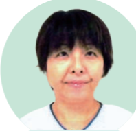
認知症看護 認定看護師

認知症の方は、入院して環境が変わると混乱し、不安になります。病棟看護師と一緒に患者さんのニーズは何かを考え、患者さんが安心して治療を受けていただけるよう支援しています。