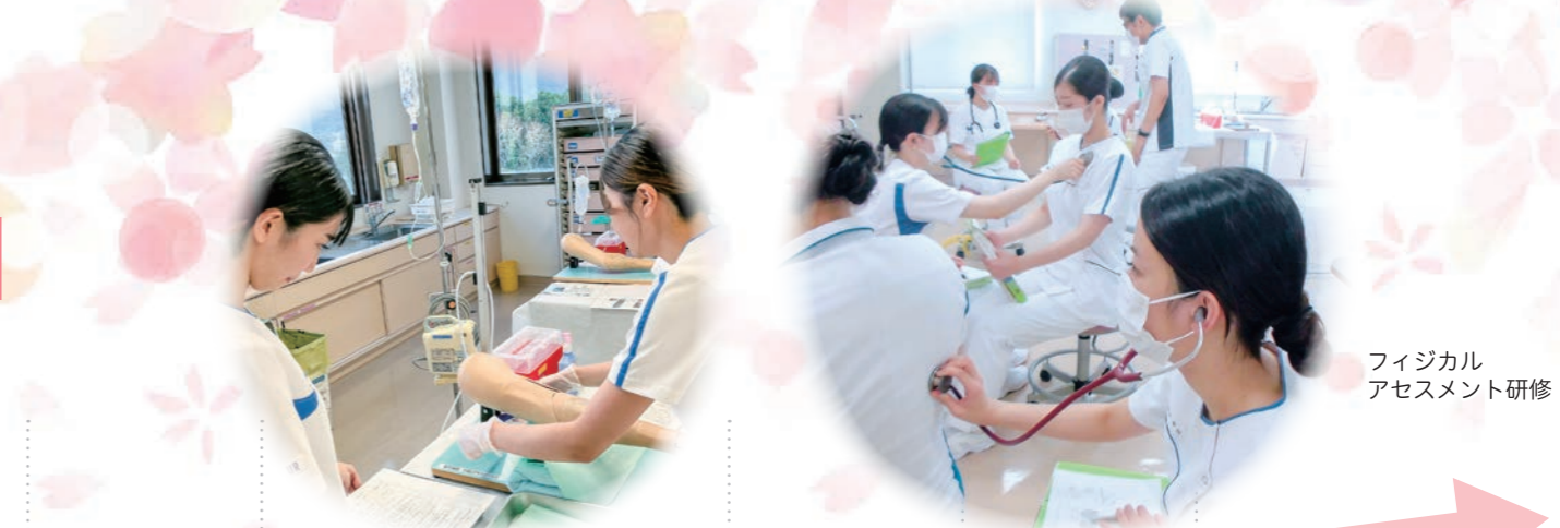
フィジカル アセスメント研修