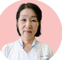
感染管理 認定看護師

患者さん、医療従事者から感染症や感染対策に関する相談に対応しています。病棟看護師と一緒に、感染対策や知識の向上に取り組み、患者さんにとって安全な療養環境づくりを行っています。