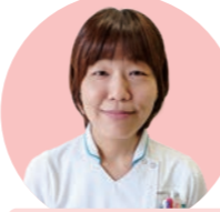
がん化学療法看護 認定看護師

患者さんや家族が少しでも穏やかに過ごせるよう、症状や気持ちのつらさなどに対応しています。病棟看護師からの緩和ケアについて相談を受けており、患者さんに必要なケアと一緒に考えたり、研修も行っています。