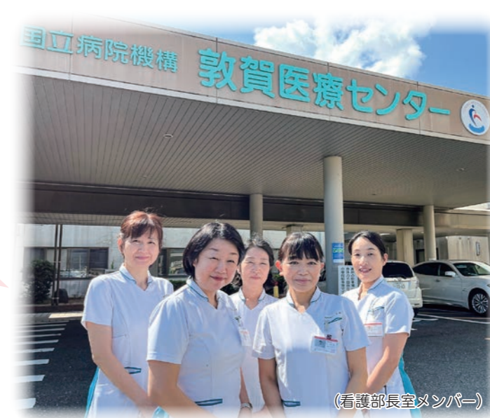
(看護部長室メンバー)