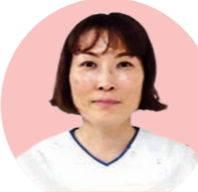
感染管理 認定看護師

患者さん、医療従事者から感染症や感染対策に関する相談に対応しています。病棟看護師と一緒に、感染対策や知識の向上に取り組み、患者さんにとって安全な療養環境づくりを行っています。